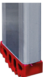
Taco interior 6,5 x 2,5 cm. Calço interior 6,5 x 2,5 cm.